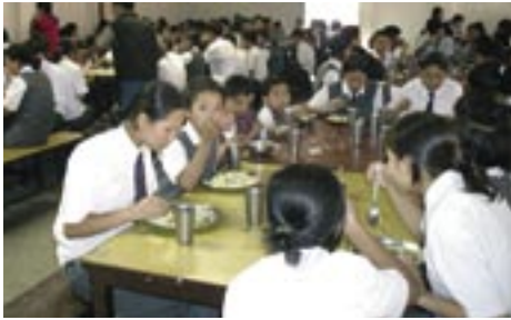
Mittagessen Daal Bhat

1 Apfel pro Woche pro Kind: CHF 100 im Monat