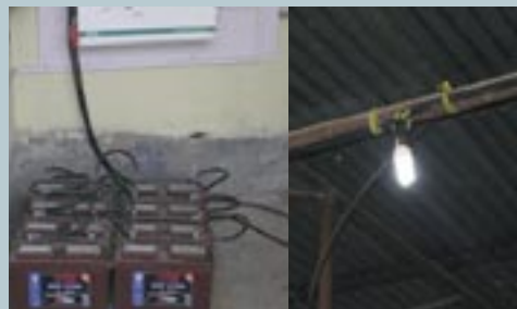
Leuchtende Glühbirne im Essaal dank Generator