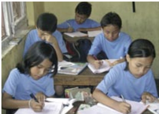
Die jetzigen Unterrichts- und Schlafräume sind eng und halten dem Monsoon nicht stand.

Der Schulbau kann mit einer Hypothek finanziert werden. Die Zinsbelastung inklusive kleiner Amortisation sind in etwa vergleichbar mit den heutigen Mietkosten. Soweit ist es aber noch nicht, denn zuerst braucht es weitere Spenden, um das Grundstück kaufen zu können. Mit den Plänen zum Bau wird nach dem Erwerb des Landes begonnen. Die Landpreise innerhalb Kathmandu sind ziemlich hoch; die Angaben wurden von verschiedenen Seiten bestätigt.