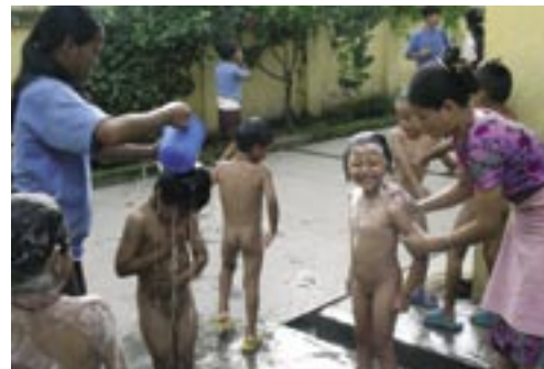
Die Kleinen werden mit dem gespeicherten Wasser aus den Tanken gewaschen.

In den Frühlingsmonaten vor dem Monsoon ist es in Kathmandu so trocken, dass vielerorts Wasserknappheit herrscht. Da die Manjughoksha Academy keine Speicherkapazitäten besitzt, wird der tägliche Schulbetrieb durch den Wassermangel stark eingeschränkt.